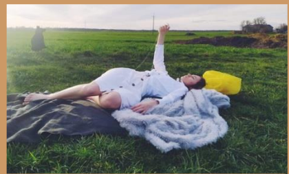
Uczniowie na łączach ze sztuki. Graficzne MNW