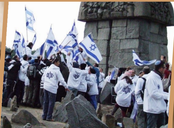
Udział w polsko-izraelskim projekcie „Jesteśmy Razem”