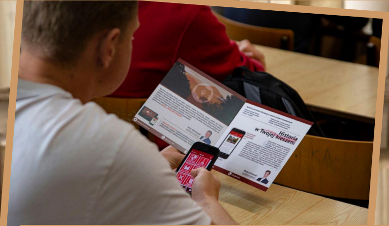
Spotkanie z twórcami aplikacji Miejsowy Patriota