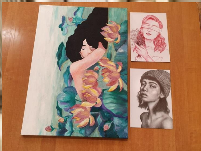
Projekt edukacyjny „Department pamięci”.