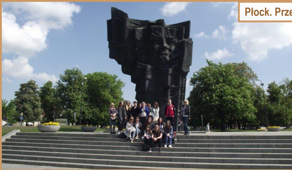
Płock. Przed pomnikiem Adama Mickiewicza

Wycieczki edukacyjne, poznanie miejsc związanych z historią i kulturą.