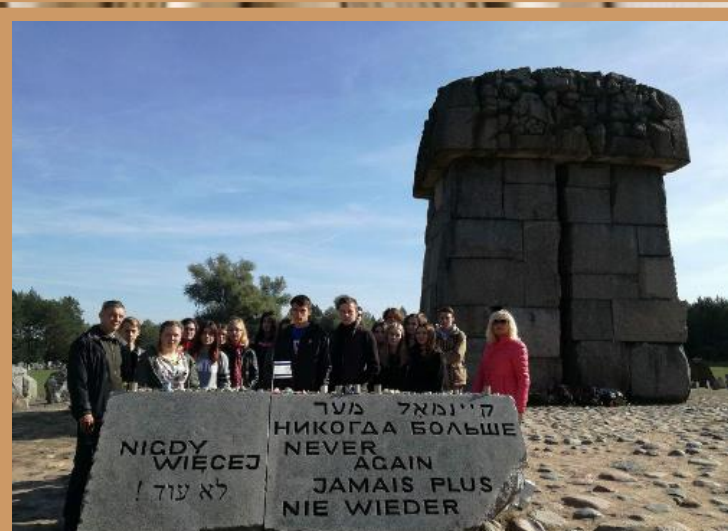
Wycieczka do Treblinki