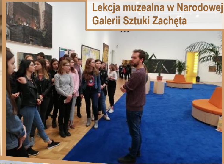
Lekcja muzealna w Narodowej Galerii Sztuki Zachęta