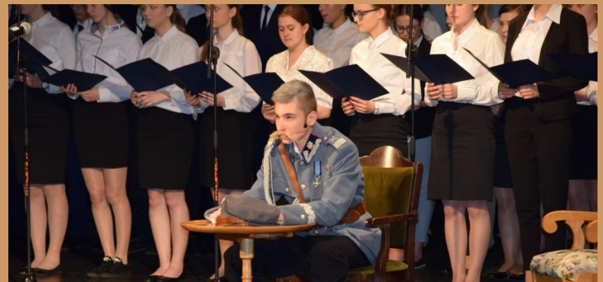
Ze wspomnień „Dziadka Piłsudskiego”. Część artystyczna w 100. rocznicę Odzyskania Niepodległości