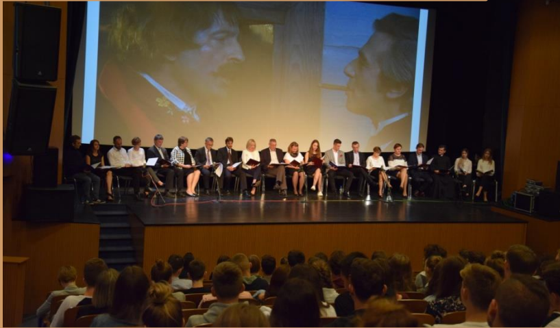
Narodowe Czytanie „Wesela” St. Wyspiańskiego

Projekty i przedsięwzięcia edukacyjne związane z tematyką literacką, patriotyczną, językoznawczą, kulturoznawczą. Kształtowanie postaw i budowanie tożsamości.