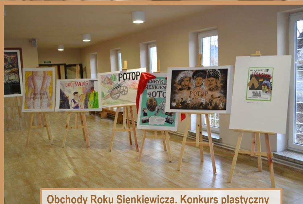
Obchody Roku Sienkiewicza. Konkurs plastyczny