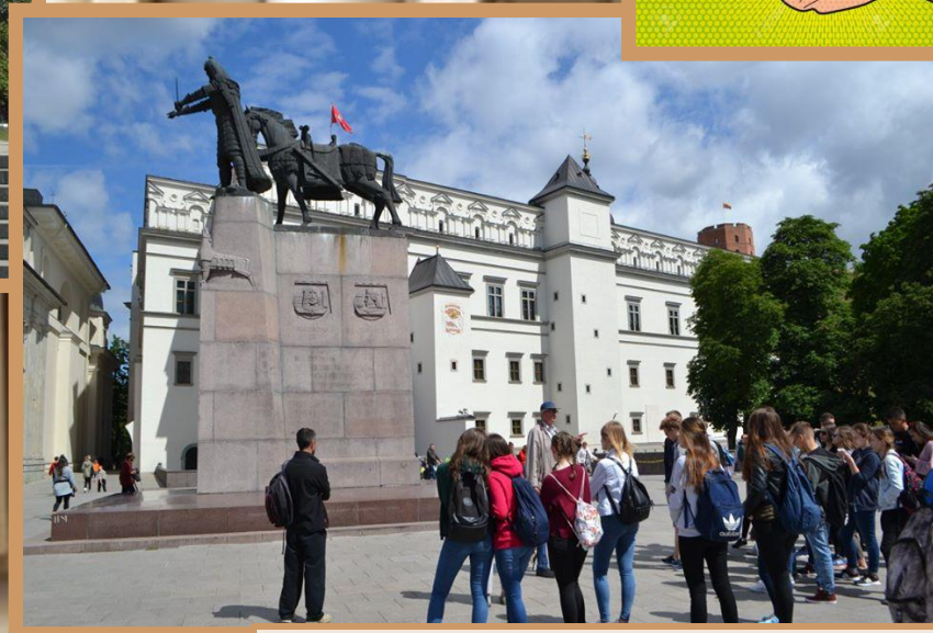
Śladami Piłsudskiego. Przystanek Wilno