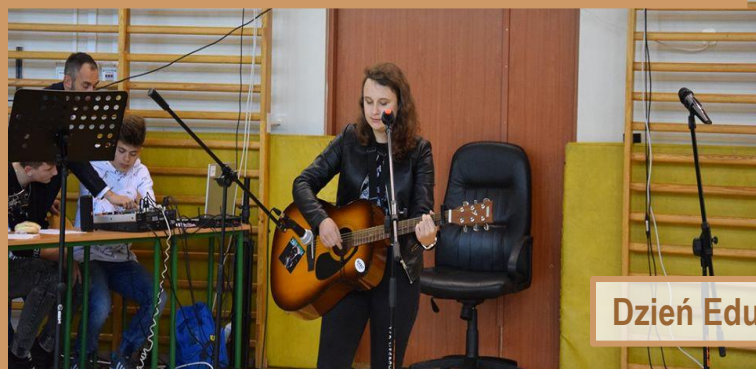
Dzień Edukacji. Autorski występ uczennicy z klasy humanistycznej