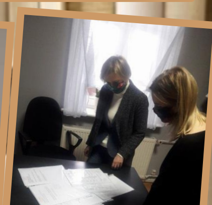
Olimpiady i konkursy. Ostatni rzut oka na prace olimpijskie