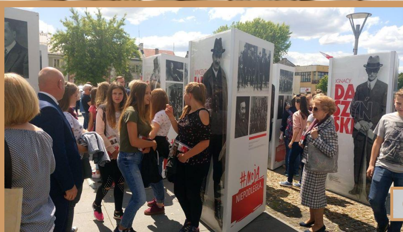
Otwarcie wystawy IPN „Ojcowie Niepodległości”