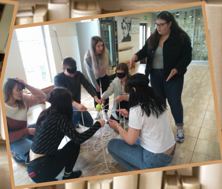
Kreatywne zadanie w ramach zajęć Umysłowy fitness