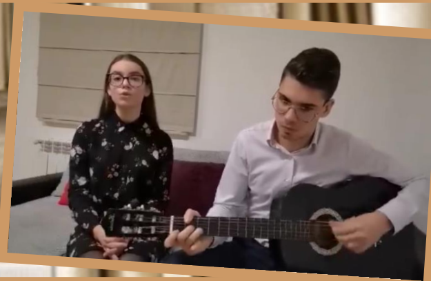
Pasje! Śpiewamy Mickiewicza!