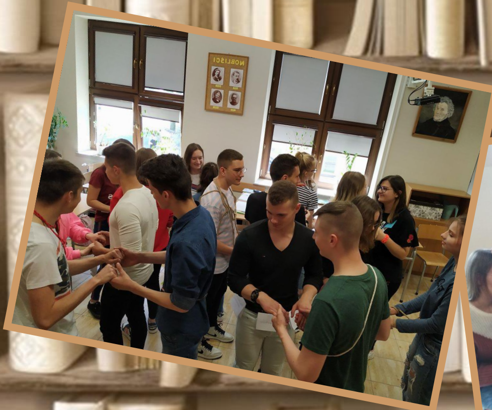
Lekcja j. polskiego - chocholi taniec inspirowany „Weselem” St. Wyspiańskiego

Zajęcia przedmiotowe realizowane przez nauczycieli nastawionych innowacyjnie wobec podejmowanych działań i stosujących nowatorskie metody nauczania.