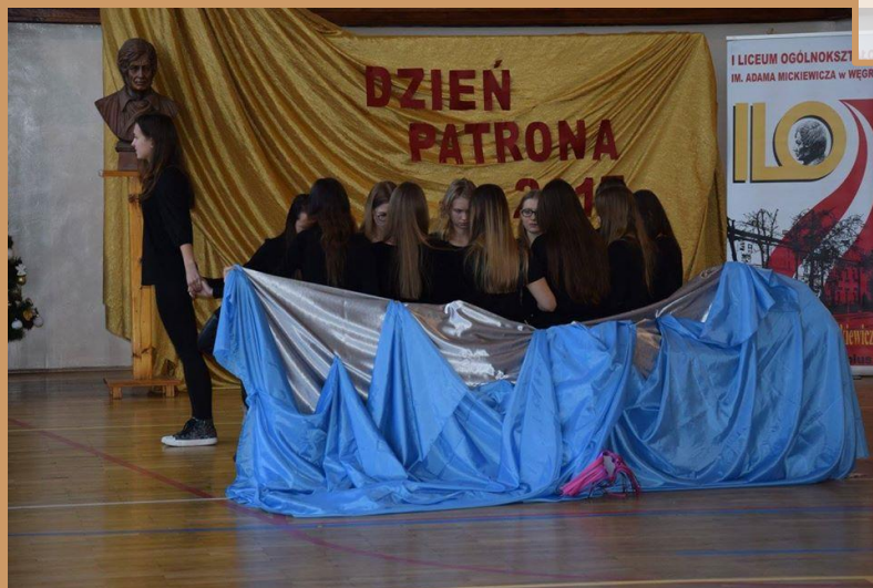
Inscenizacja „Burzy” A. Mickiewicza

Szkolne konkursy teatralne, filmowe, literackie, fotograficzne, plastyczne, taneczne i muzyczne organizowane m.in. w ramach Obchodów Dnia Patrona, Roku Wielkiego Polaka i Przełomowego Wydarzenia. Możliwość zaprezentowania własnych talentów podczas uroczystości szkolnych i lokalnych.