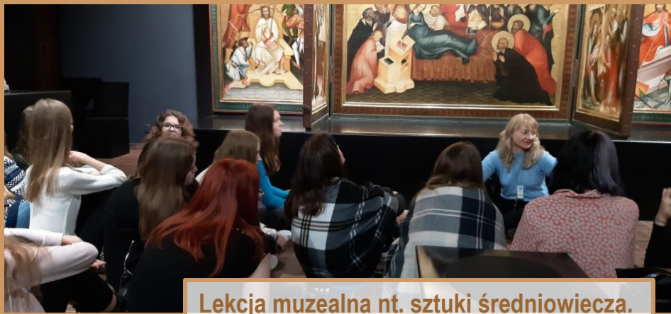
Lekcja muzealna nt. sztuki średniowiecza. Muzeum Narodowe w Warszawie

Bogata oferta kulturalna - lekcje muzealne, wyjścia na seanse filmowe (Lekcja w kinie), wyjazdy na spektakle teatralne i do opery, udział w wystawach, koncertach i innych wydarzeniach oferowanych przez instytucje kultury i nauki.